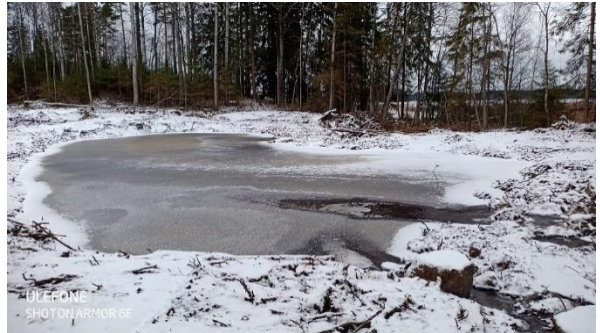
Sirosen laskeutusallas Takajärven rannassa.

Tilalla Siironen laajennetaan Takajärven rannassa vanhaa laskeutusallasta ja rakennetaan pohjapadot altaan ylä- ja alapuolelle. Altaan koko on noin 15 x 40 metriä. Kohde on toteutettu marraskuussa 2022.