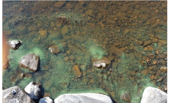
Sinilevää Alajärven Sammonlahden suulla sunnuntaina 10.6.

Vauhdikas kasvukauden alku näkyi myös veden levämäärän lisääntymisenä. Kesäkuussa veden kirkkaudesta kertova näkösyvyys oli vain 1,7 m kun se esimerkiksi edellisenä vuonna samaan aikaan oli 2,6 m. Valitettavasti myös sinilevää on havaittu Alajärven itärannoilla jo useampaan kertaan kesäkuun aikana.